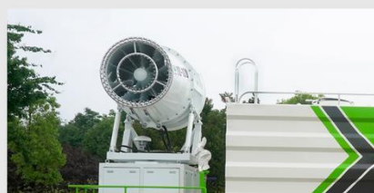
车载式风送喷雾机组 ↑